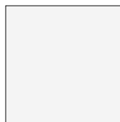
Cool White Ref 1502