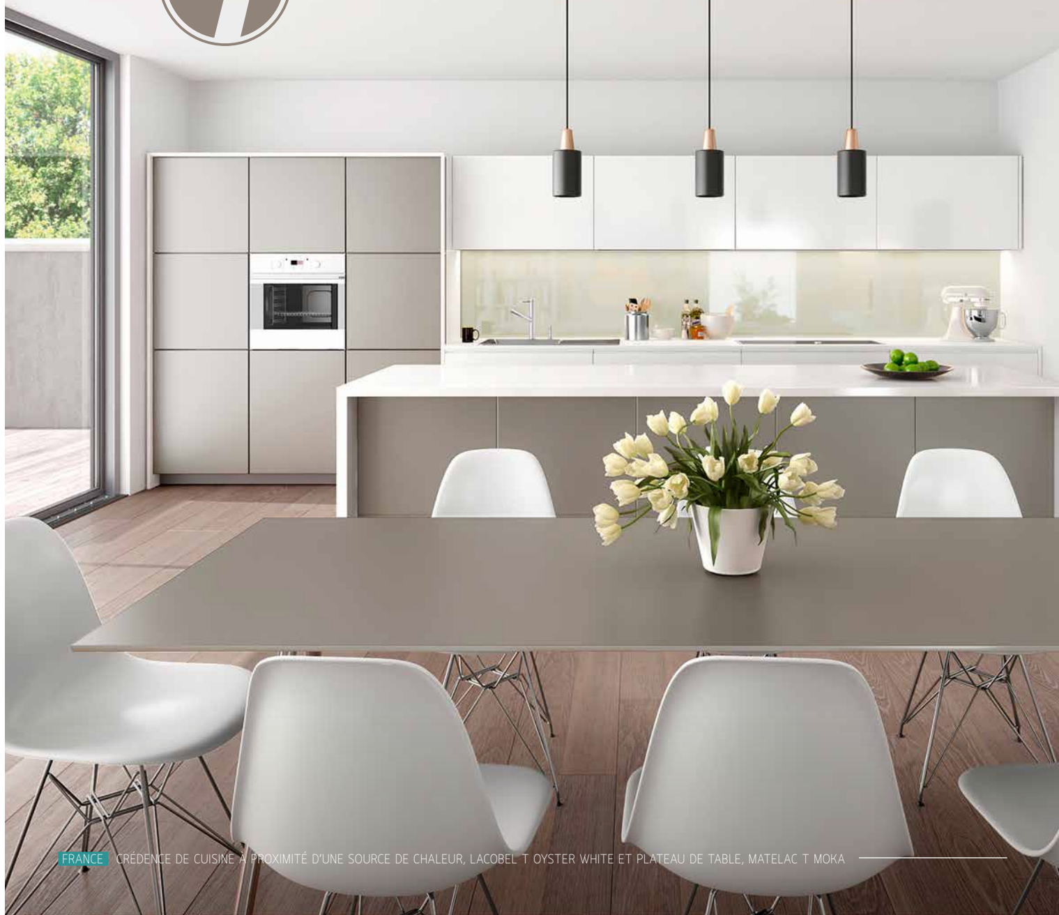
FRANCE CRÉDENCE DE CUISINE À PROXIMITÉ D'UNE SOURCE DE CHALEUR, LACOBEL T OYSTER WHITE ET PLATEAU DE TABLE, MATELAC T MOKA