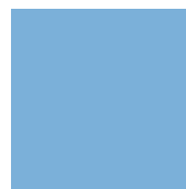
Light Blue Ref 1413